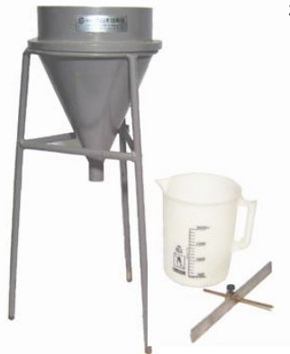
Model No・DC-13 (P ロート)

■DC-14/15PC グラウト流下試験器は土木学会の規格品で、流下式のコンシステンシー測定をするのに使 用します。(材質は鉑金製)